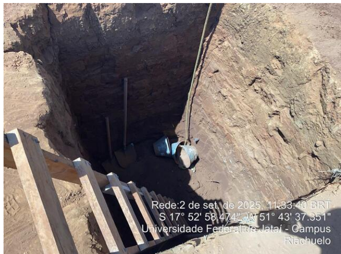
Vala da sapata, sem forma e sem armadura